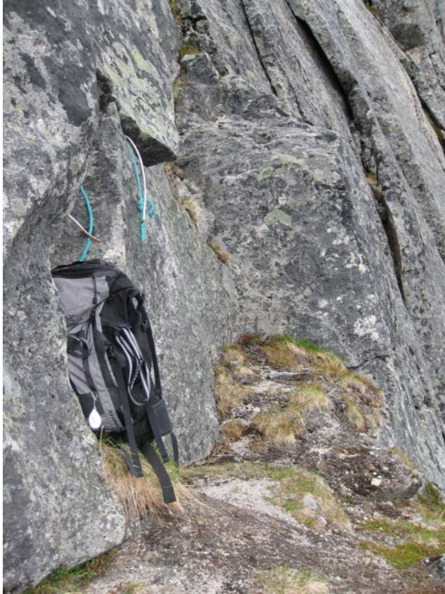
Bilde 5. Ulykkesstedet på undersøkelsesdagen: Stians sekk og rappellfestet med brudd på nylontau og stålvaier.