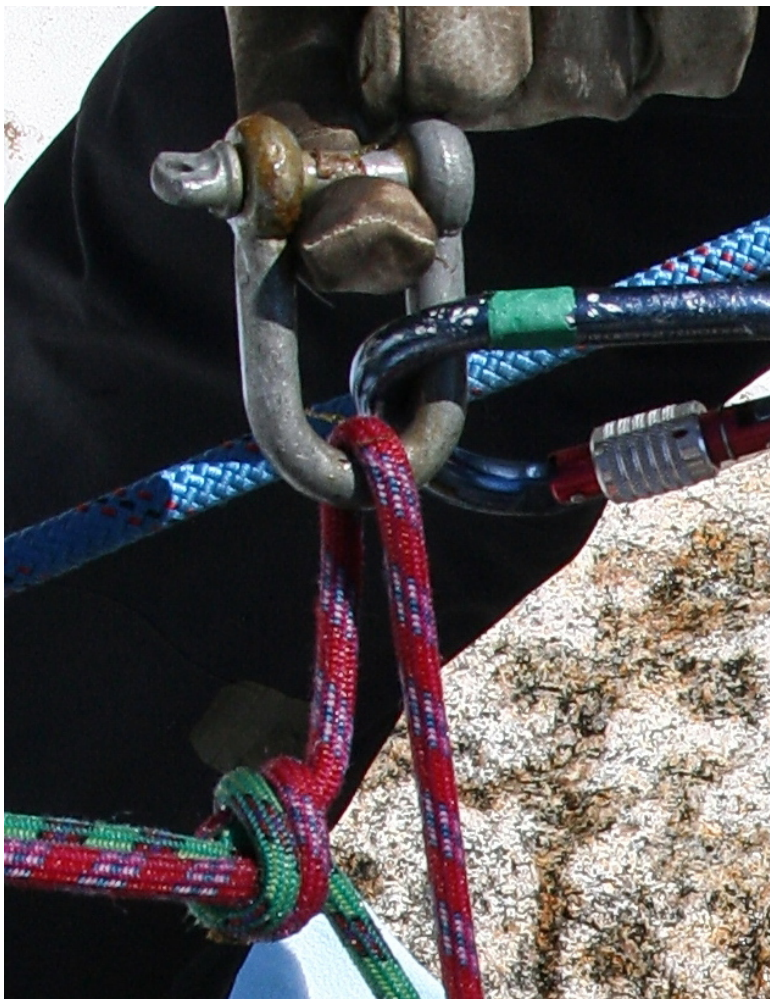
Bilde 8. Sjakkelen fra rappellfestet slik den ble funnet på rappelltauet.