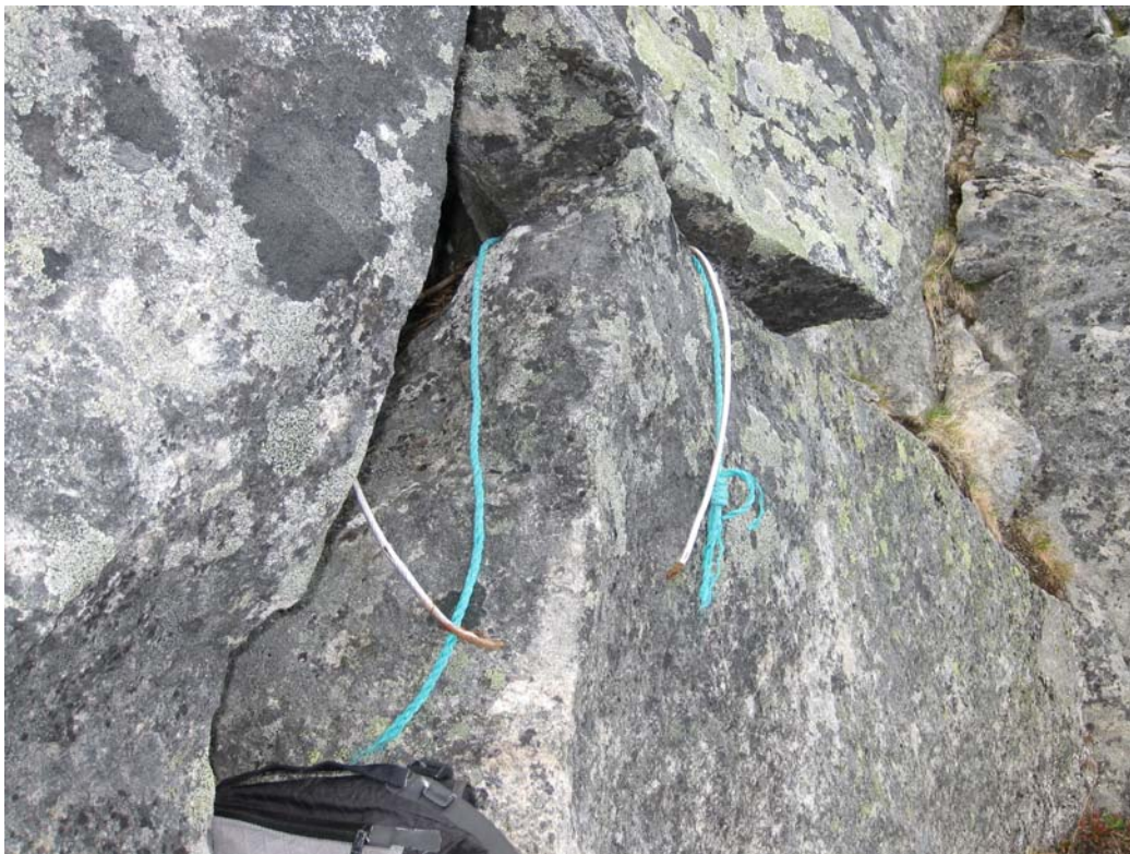
Bilde 6. Rappellfestet med bruddstedet. Både nylontauet (turkis) og den plastbelagte stålvaieren (hvit) har røket. Forlengeren opp til de to ekstra forankringene er skjult bak steinblokkene.