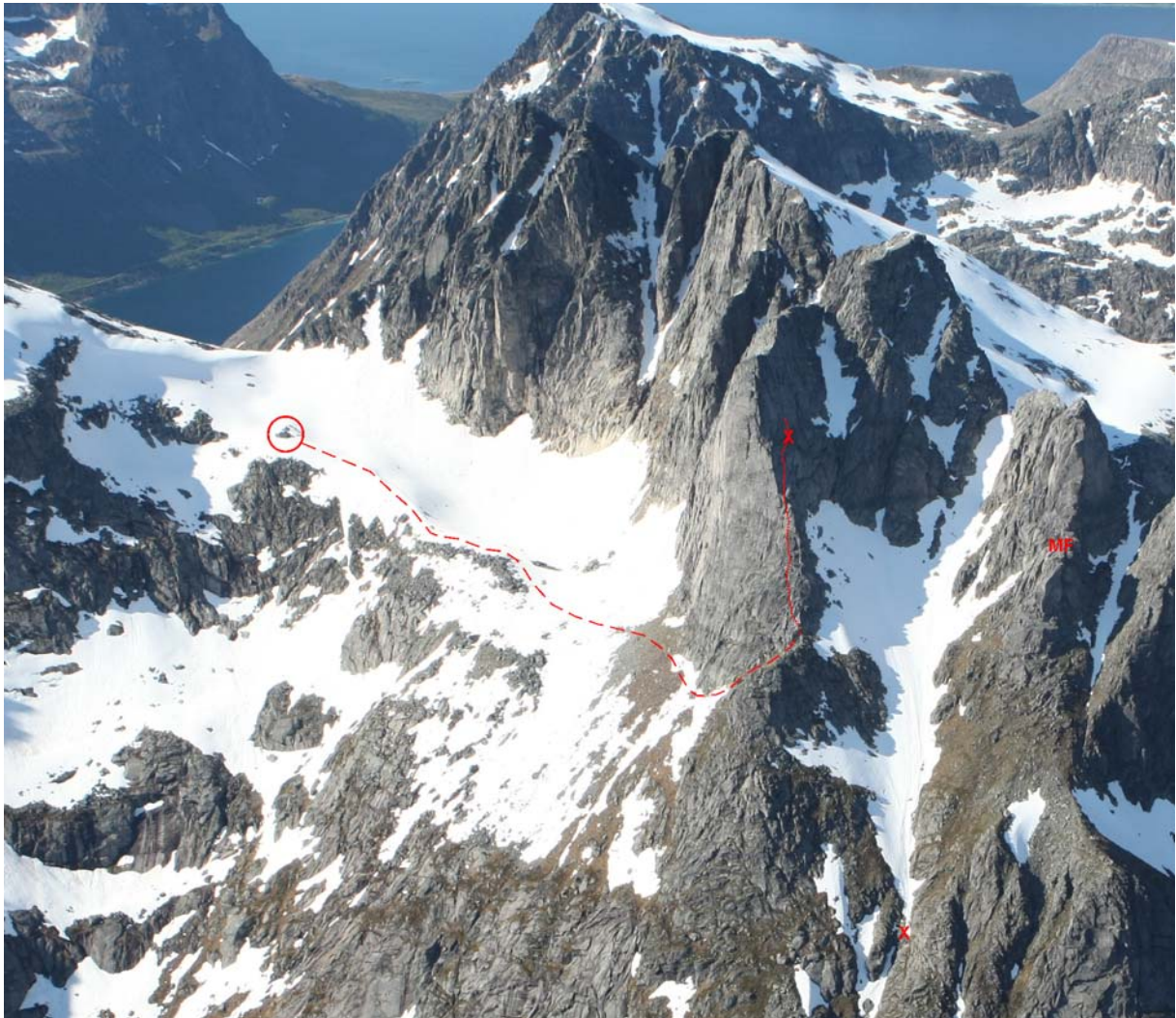
Bilde 1. Oversikt over Hollenderan. Sirkelen ringer inn Hollenderhytta. Stiplet linje viser anmarsjen til Baugen; prikket linje viser klatreruta opp til snupunktet. De to x-ene markerer ulykkesstedet og funnstedet. MF er fortoppen på Masta.