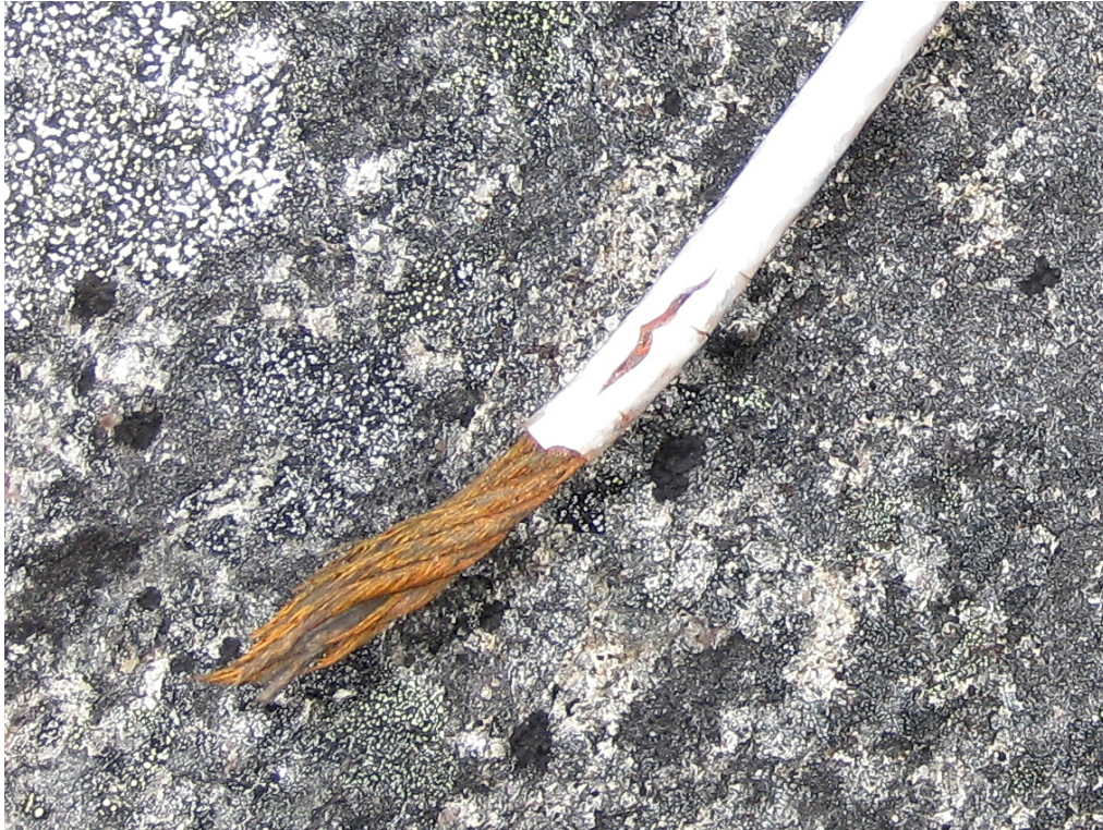
Bilde 7. Detalj av bruddstedet.