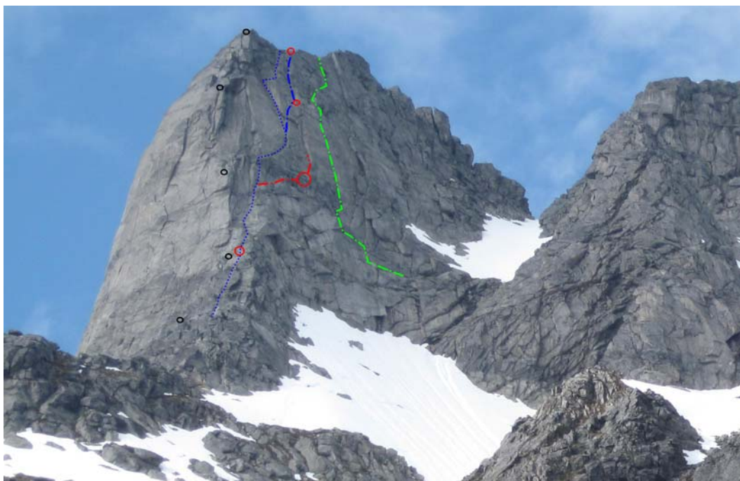
Bilde 3. Baugen med Vårhusen (blå linje) og guttenes rute sett fra Blåmannsvikdalen. Rød linje: Klatreruta fra traversen ut fra Vårhusen og opp til snupunktet. Stor, rød sirkel: ulykkesstedet. Små, røde ringer: posisjonene til de øvrige rappellfestene på 1987-ruta. Svarte ringer: De 5 øverste festene på dagens rappellrute. Grønn linje: "Jammer", eneste dokumenterte rute på Baugen til høyre for Vårhusen.